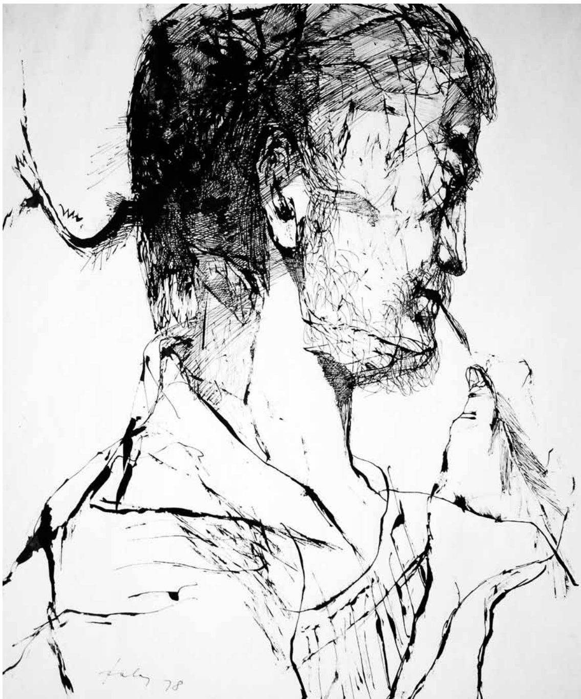
A költő tollrajz 48x40 cm 1978