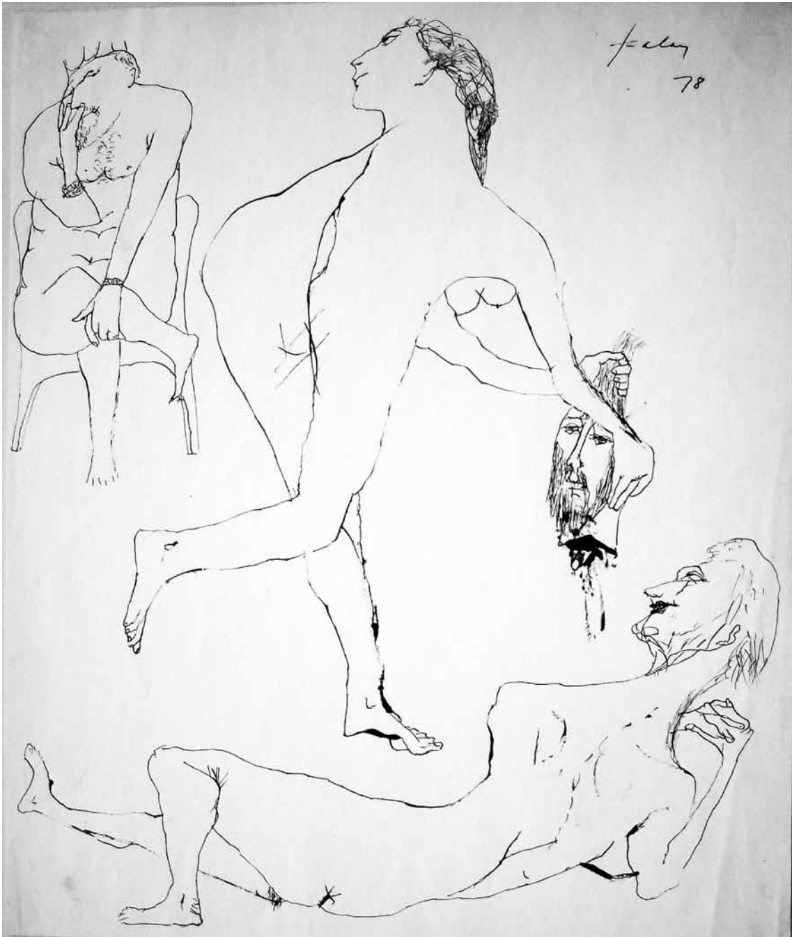
Salome tollraj 48x40 cm 1978