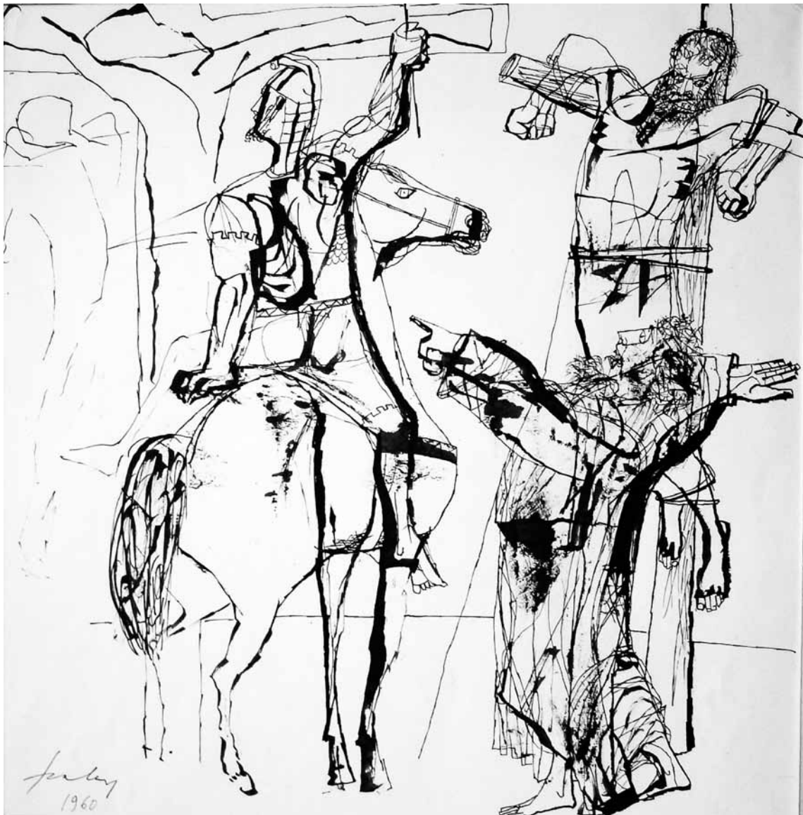
Júdás tollrajz 33x32 cm 1960