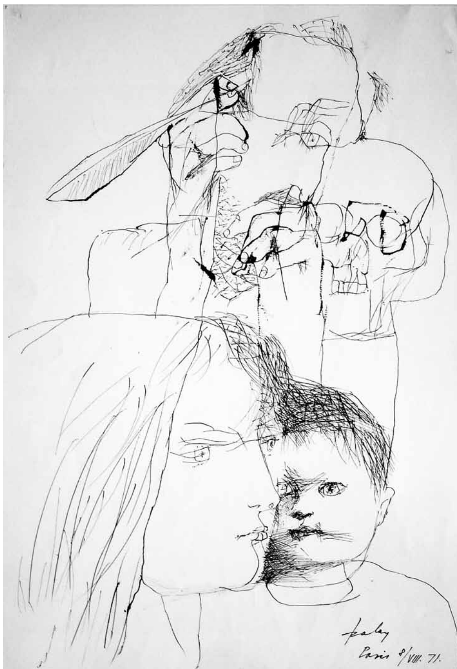
Család tollrajz 42x29 cm 1971