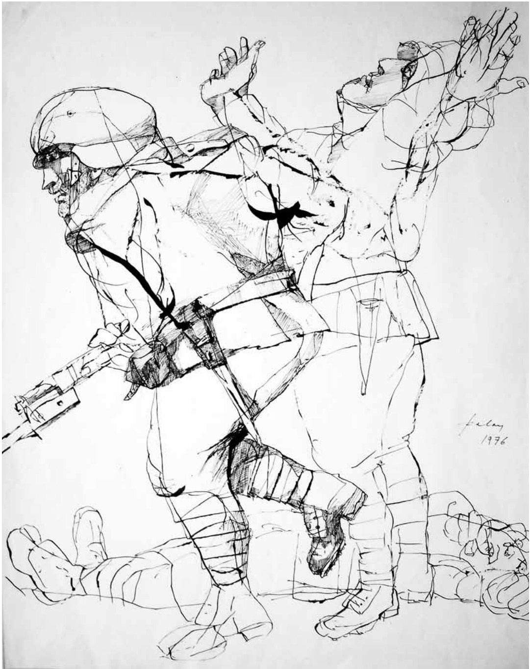
Roham tollrajz 50x40 cm 1976