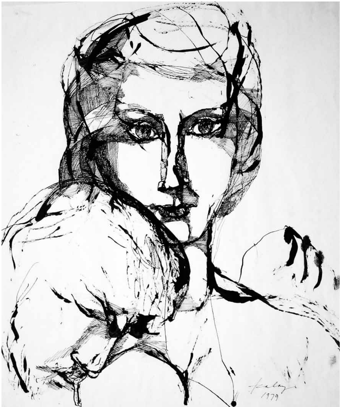
Hágár tollrajz 48x40 cm 1979